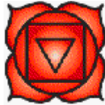
Planche 8 (couleur blanche)

Le chakra de la base de la colonne vertébrale. Le chakra de la base de la colonne vertébrale, qui a quatre pétales, donne le modèle de l'épanouissement de la flamme de la Mère dans les quatre corps inférieurs de l'homme. Ce chakra est aussi l'assis du corps physique. Notre corps physique tout entier est une manifestation de la Mère parce qu'il est le point de concentration de l'Esprit dans l'univers matériel. C'est à partir de ce point que l'homme s'élève en vue de la réunion de la Mère et du Père au sommet de la tête, qui fait naître le Christ au centre du cœur.