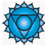
Planche 3 (couleur bleue)

Le chakra de la gorge. Le chakra de la gorge, qui réunit seize pétales de lumière, est le centre du pouvoir en l'homme. Les seize fréquences destinées à la précipitation sur les autres plans de la Matière correspondent au modèle de pensée de la pyramide - quatre pétales de chaque côté de la pyramide, de chaque côté du carré - un mandala très important pour la Parole devenant chair, pour l'Esprit devenant tangible dans la Matière.