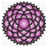
Planche 5 (couleur jaune doré)

Le chakra du sommet de la tête. C'est au sommet de la tête que l'homme est destiné à concentrer la conscience de Dieu. Le chakra du sommet de la tête s'appelle le lotus aux mille pétales. Il est d'un jaune doré et il a 97 pétales.