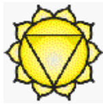
Planche 6 (couleur pourpre)

Le chakra du plexus solaire. Le plexus solaire, la « place du soleil », est la place où nous employons l'énergie de l'émotion en tant qu'énergie de Dieu en mouvement afin de concentrer la paix de la conscience de Dieu, la paix de Jésus-Christ ascensionné. Quand votre plexus solaire est calme, vous avez le pouvoir de la paix; et, utilisant tout le potentiel du corps de désir, vous avez toute la force d'impulsion de l'Océan Pacifique, de l'eau coulée dans une matrice d'amour. Ce pouvoir de rayon de pourpre et d'or du désir de Dieu d'être Dieu surgit quand vous élevez l'énergie depuis le plexus solaire jusqu'au niveau de la gorge et, comme l'a fait Jésus, émettez le commandement: